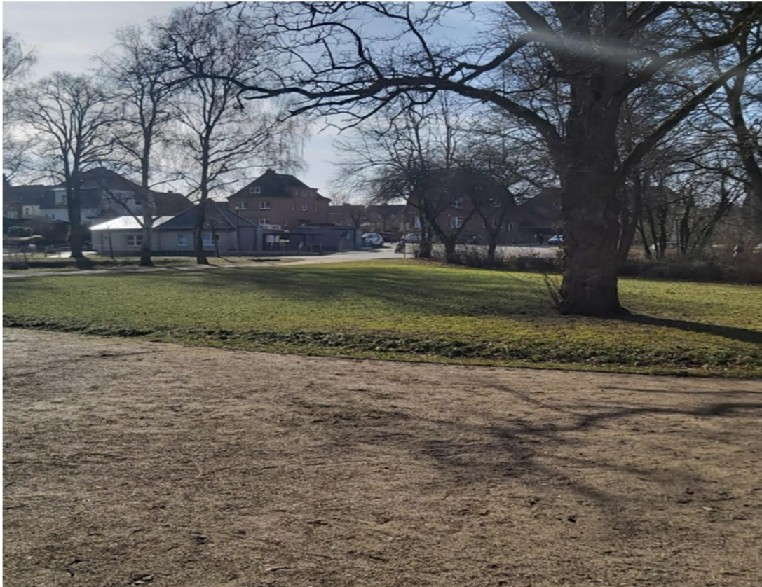
*Abb. 2 Sicht vom Spielplatz

Auf dem Grundstück der „Eisterrasse am Bürgerpark“ befindet sich ein weiteres WC, was - wie der Name bereits verrät „am Bürgerpark“ - zu finden ist. Die WC-Anlage ist, wie auch die im Vereinshaus, in ca. zwei Gehminuten - ausgehend vom Spielplatz - zu erreichen.