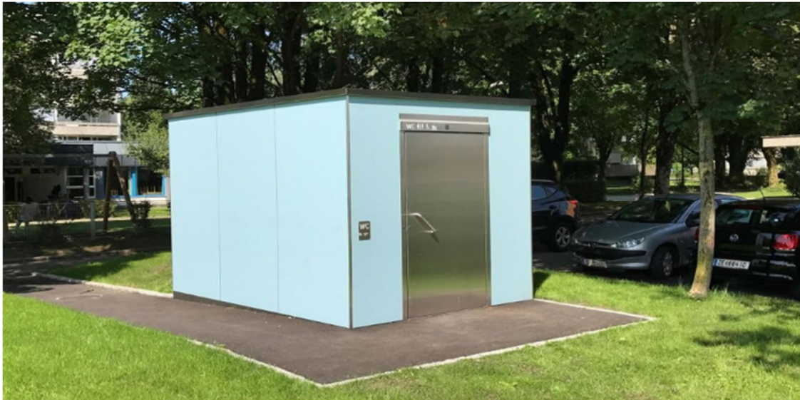
*Abb. 4

Nach Internetrecherche sowie Angebotseinholung wird das kostengünstigste Fabrikat in der nachstehenden (*Abbildung 4) vorgestellt.