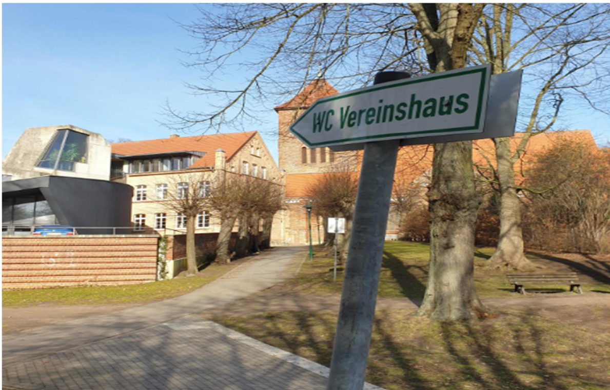
*Abb. 1 Sicht vom Spielplatz

Direkt am angrenzenden Spielplatz der Bürgerwiese befindet sich das Museum und Vereinshaus Grevesmühlen. Auf halbem Weg in Richtung Kirche befindet sich der Eingang zum Vereinshaus, in dem eine Sanitäreinrichtung zu finden ist. Diese unterliegt der stetigen und regelmäßigen Reinigung sowie Wartung - verwaltet durch die Stadt Grevesmühlen