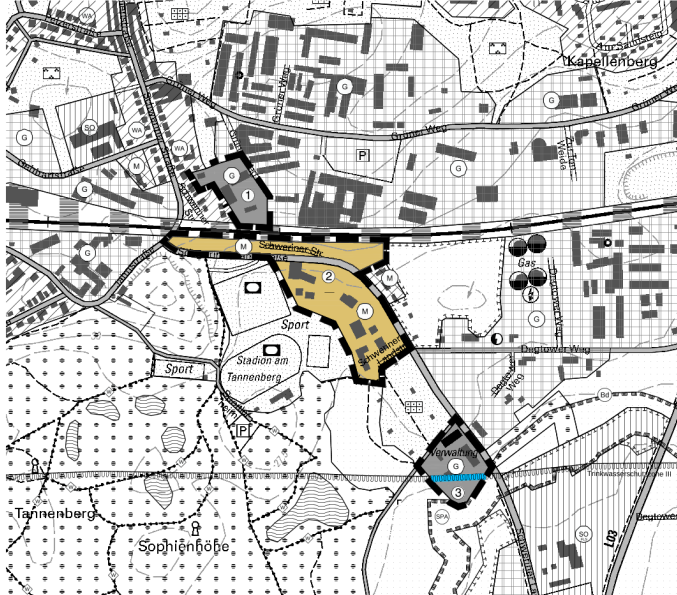
8. Änderung des Flächennutzungsplanes der Stadt Grevesmühlen Änderungsbereich 1: Gewerbliche Bauflächen (§ 1 Abs. 1 Nr. 2 BauNVO)