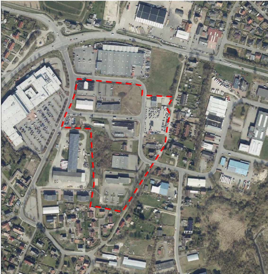
Luftbild des Plangebietes, © GeoBasis - DE/M-V, 2022

Der Geltungsbereich der 7. Änderung des Bebauungsplanes Nr. 1 umfasst die Flächen des Ursprungsplanes bzw. der rechtskräftigen Änderungen, in denen Einzelhandelsbetriebe mit nahversorgungs- und zentrenrelevanten Sortimenten zulässig sind. Nicht im Geltungsbereich der 7. Änderung sind die Sonstigen Sondergebiete „Großflächige Handelsbetriebe“ (MEZ) und „Baumarkt“ sowie der Geltungsbereich der 3. Änderung und Ergänzung, da dort bereits Einzelhandelsbetriebe für unzulässig erklärt wurden.